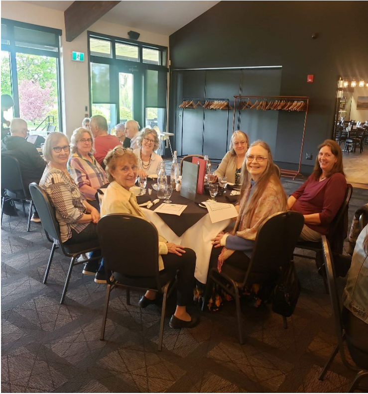
Comité UTA à Napierville