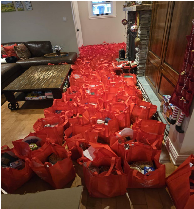
Sac de Noel pour la Marche des biscuits