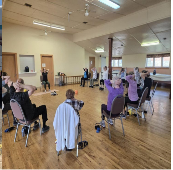
Gym à Hemmingford