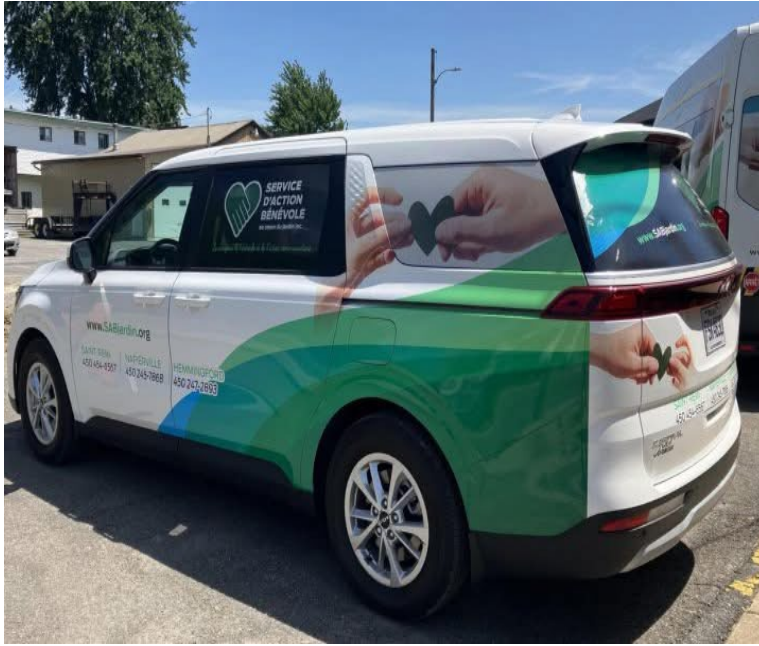
Mini-van utilisée pour usagers de Napierville