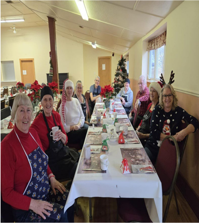
Bénévoles heureux à Hemmingford