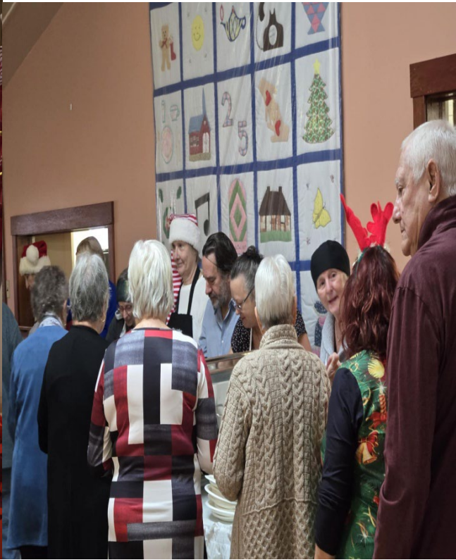
Repas de Noel à Hemmingford