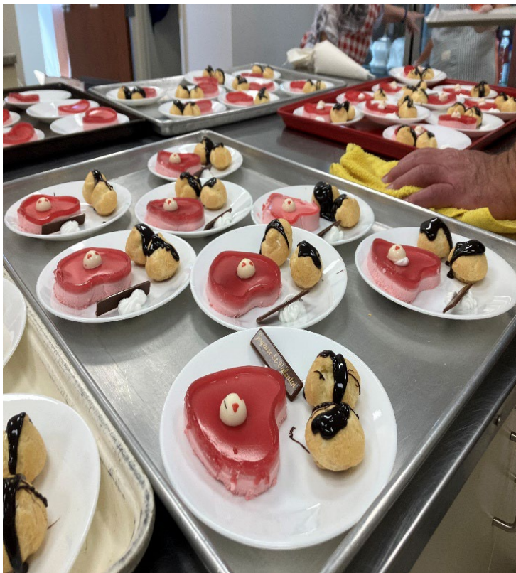
Dessert fait par nos bénévoles de Napierville