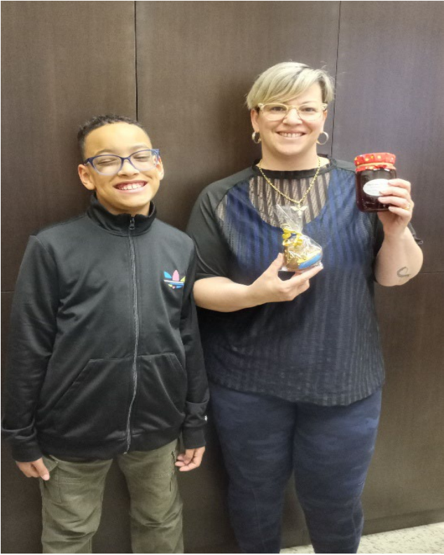
Gym en plein-air à Napierville